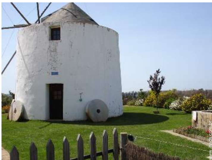
Antigo moinho de Encanto