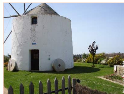
Antigo moinho de Encanto