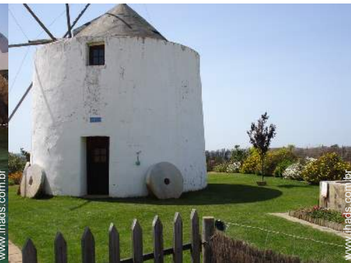
Antigo moinho de Encanto