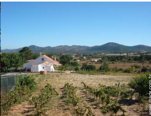
vista a partir da casa