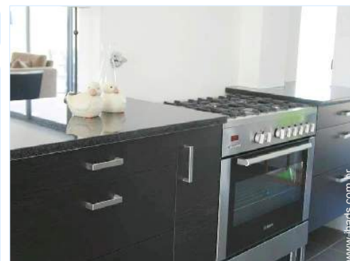
grande cozinha americana

Barbecue, mesa(s) de jardim, 6 cadeira(s) de jardim, carrinho de chá