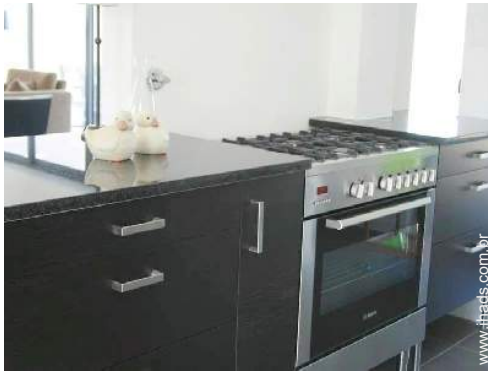
grande cozinha americana