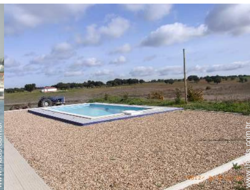
vista a partir da piscina