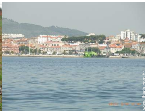
atividades balneares nas proximidades