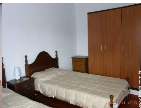
quarto de amigos