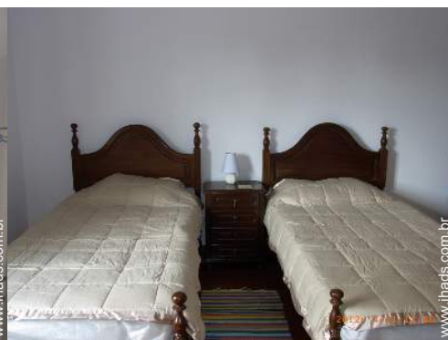
quarto de amigos