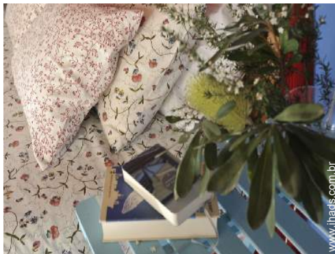
Conforto interior à disposição dos hóspedes