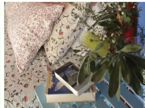
Conforto interior à disposição dos hóspedes

Barbecue, mesa(s) de jardim, 6 cadeira(s) de jardim, caramanchão, guarda-sol, 4 espreguiçadeira(s), 2 cama de rede, baloiço para criança, duche exterior