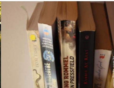
coleção de livros