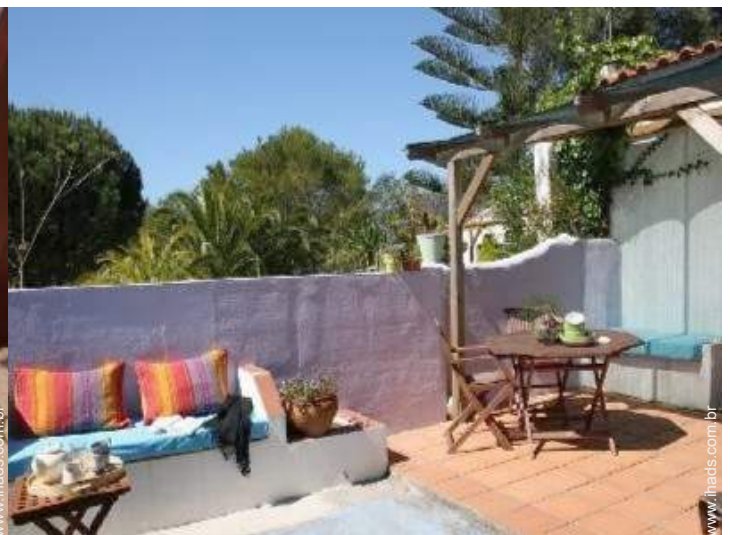
Ambiente exterior à disposição dos hóspedes