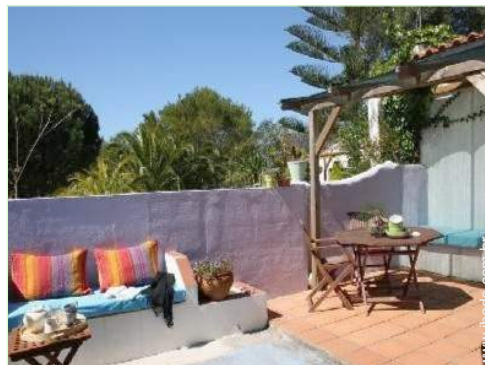
Ambiente exterior à disposição dos hóspedes

Adaptado para deficiência : visual, auditiva, mental