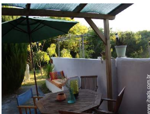
vista a partir da casa