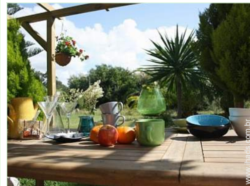
vista a partir do terraço