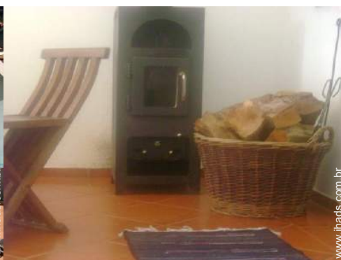
fogão a lenha