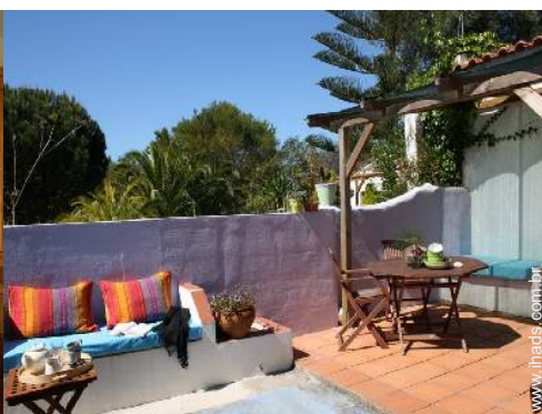
vista a partir do terraço