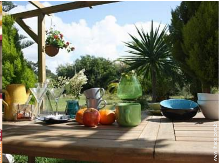
vista a partir do terraço