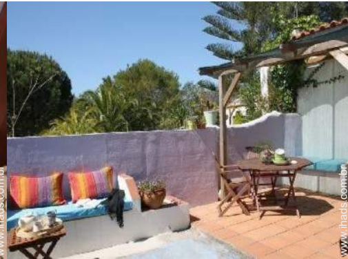
Ambiente exterior à disposição dos hóspedes