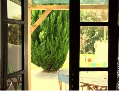
vista a partir da sala de estar