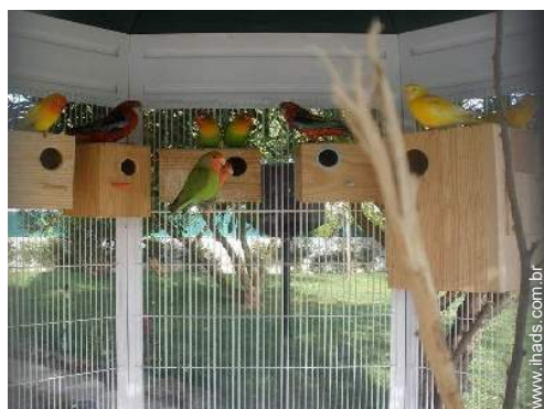
Os animais da casa