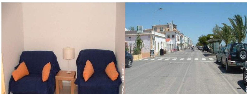
cama(s) convertível/eis dupla(s)