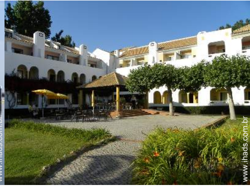
vista para rio