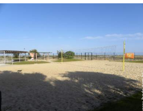
campo de vôlei