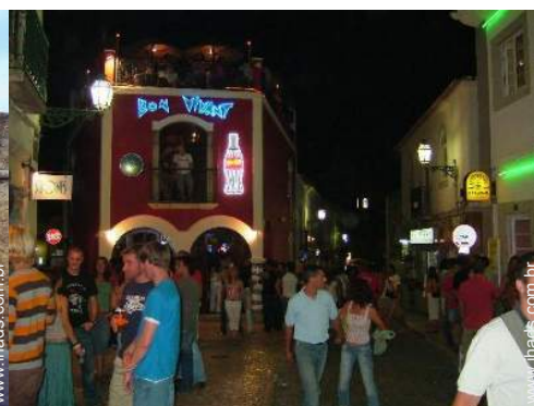
Atrações e lazer