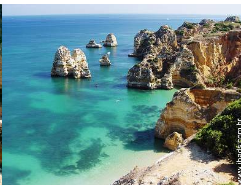
praia de naturismo