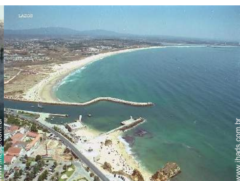
porto de recreio