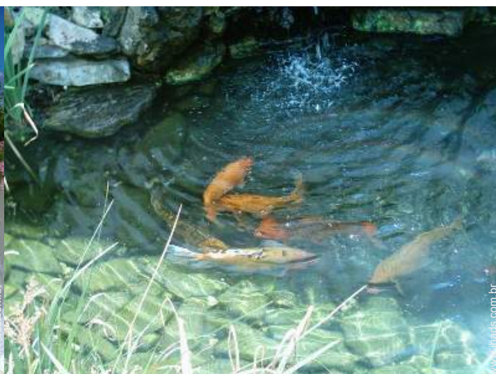
lago de jardim