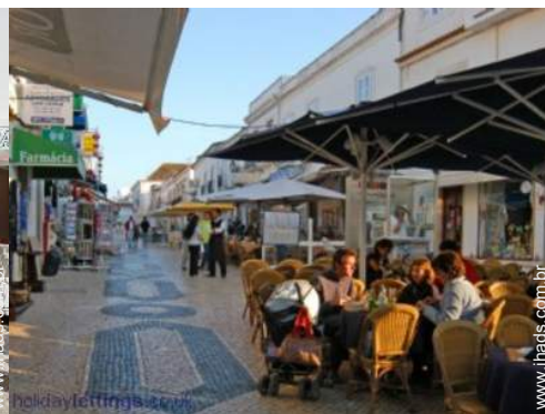
centro da cidade