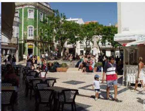
centro da cidade