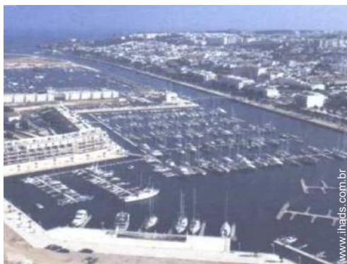
porto de recreio