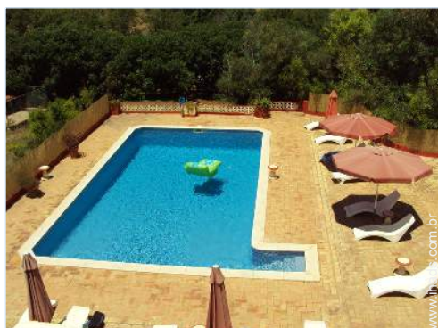
vista sobre piscina