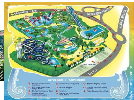
parque de lazer