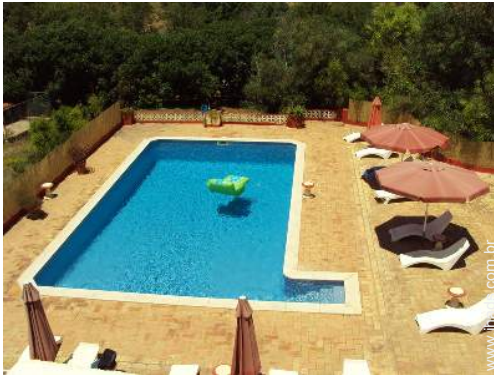
vista sobre piscina