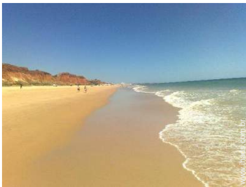
atividades balneares nas proximidades