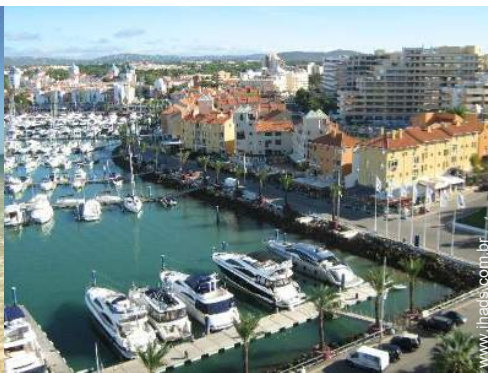
porto de recreio