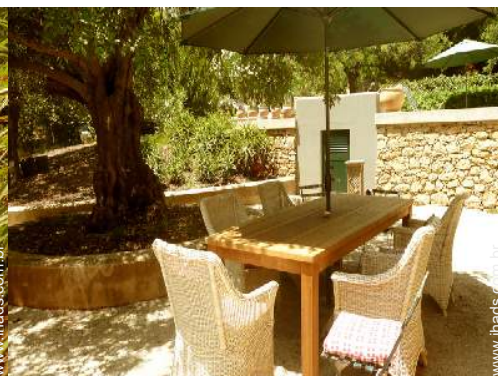
Instalações exteriores à disposição dos hóspedes