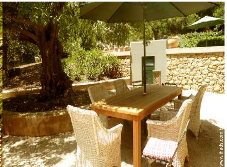
Instalações exteriores à disposição dos hóspedes