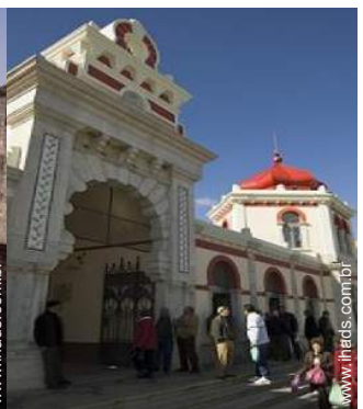
Cidades nas proximidades