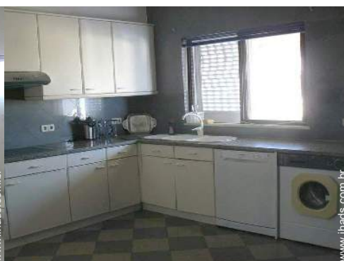
grande cozinha independente