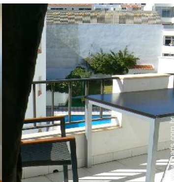
vista a partir da varanda