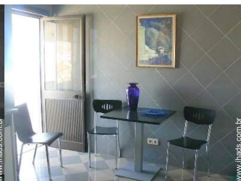
grande cozinha independente