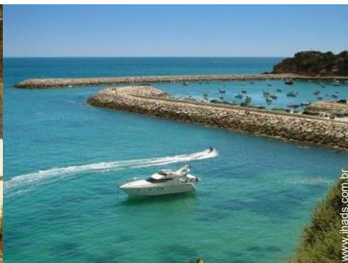
porto de recreio