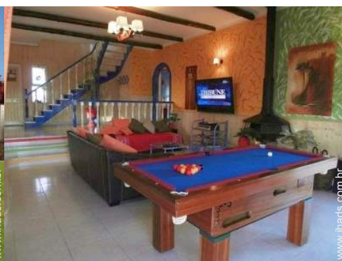
mesa de bilhar