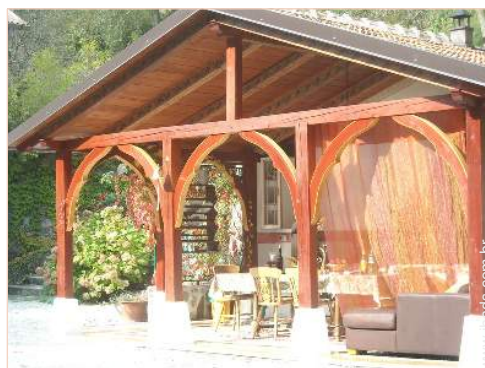
salão de música