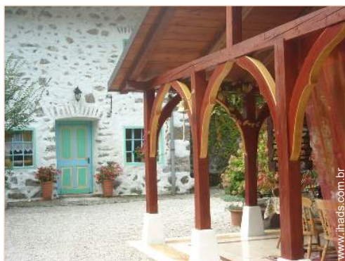
vista a partir do terraço coberto