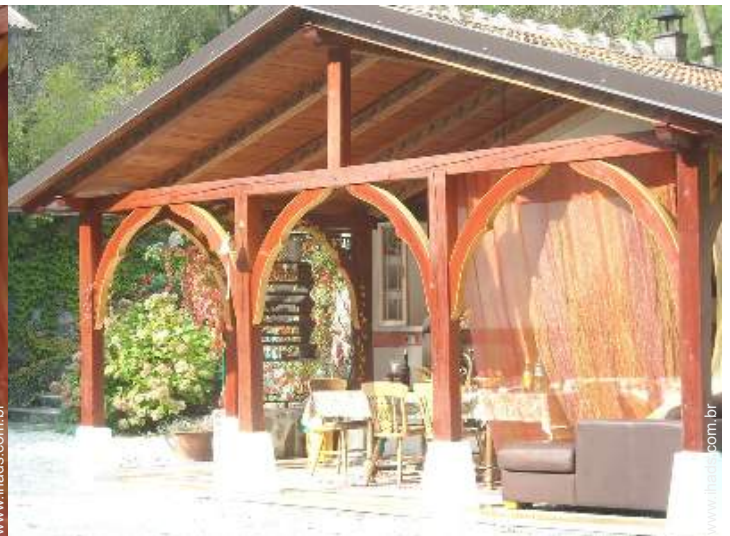
salão de música