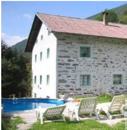
vista a partir da piscina