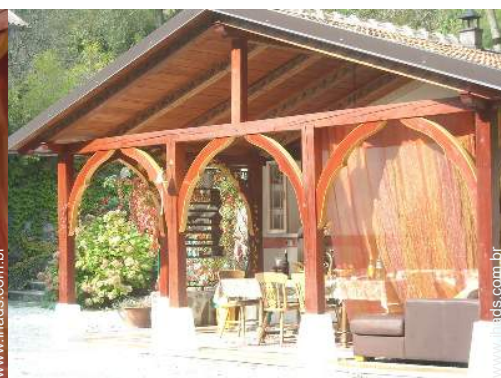
salão de música