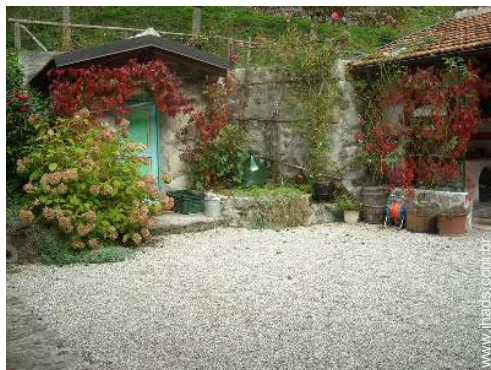
caves e provas de vinho