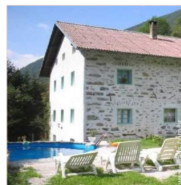
vista a partir da piscina