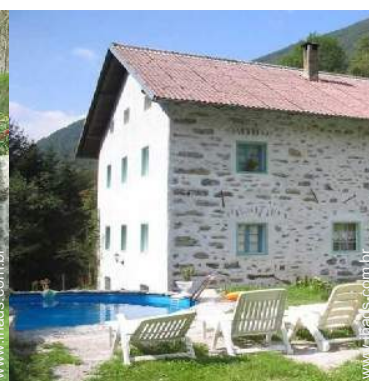
vista a partir da piscina