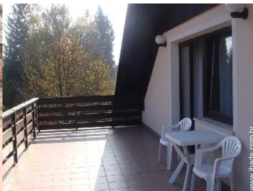
terraço no telhado