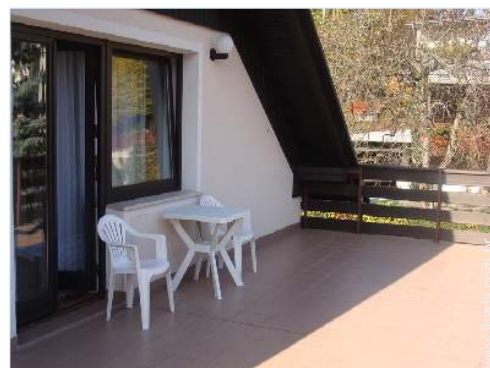
terraço no telhado