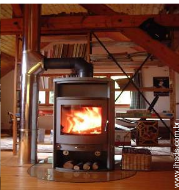
fogão de lenha sueco