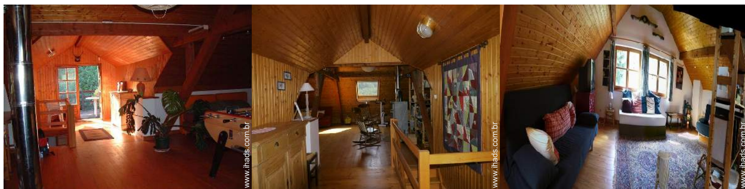
salão de jogos