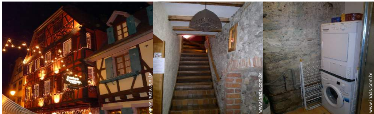
Divisões e comodidades