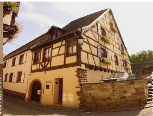
Habitação de Encanto