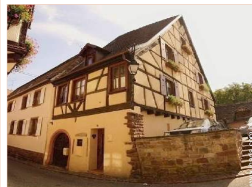
Habitação de Encanto