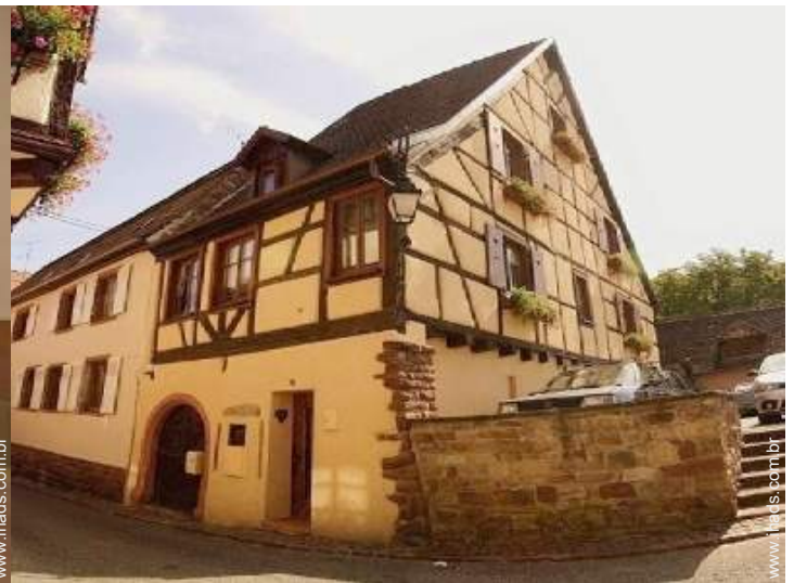
Habitação de Encanto