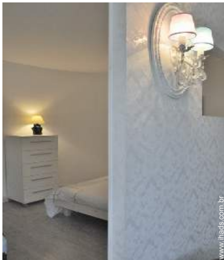
vista a partir do salão