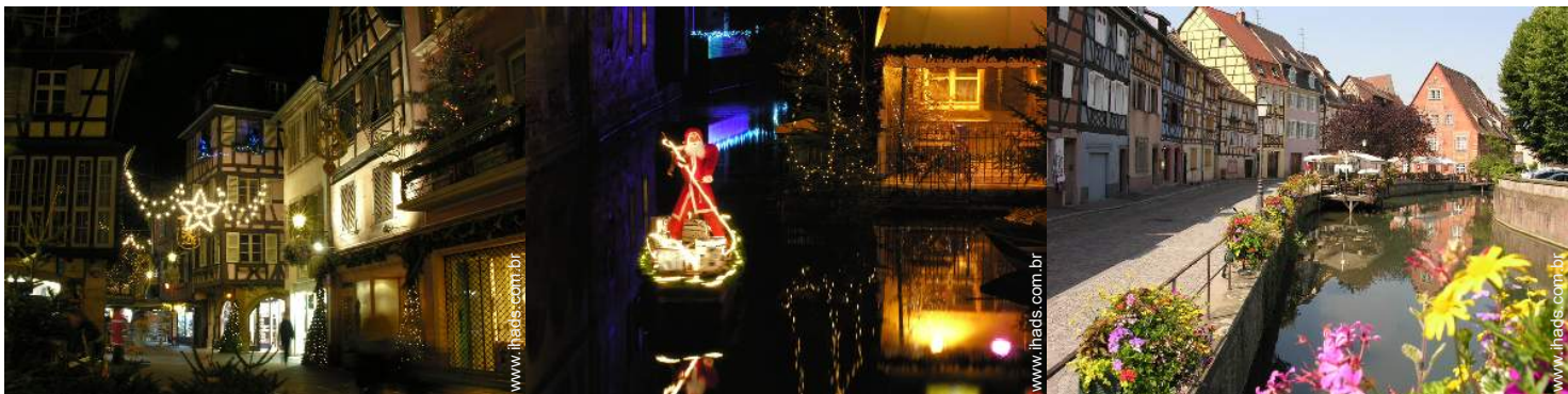
vista para praça