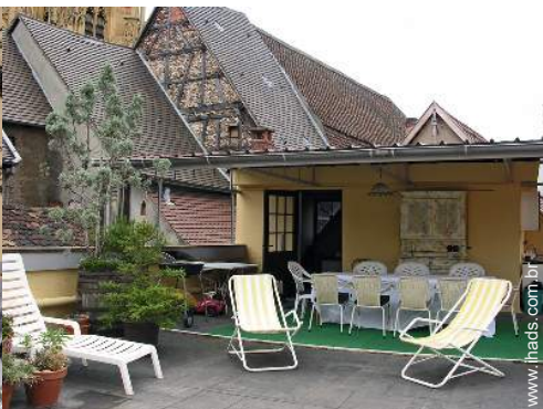
salão de verão