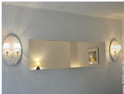
vista a partir do salão