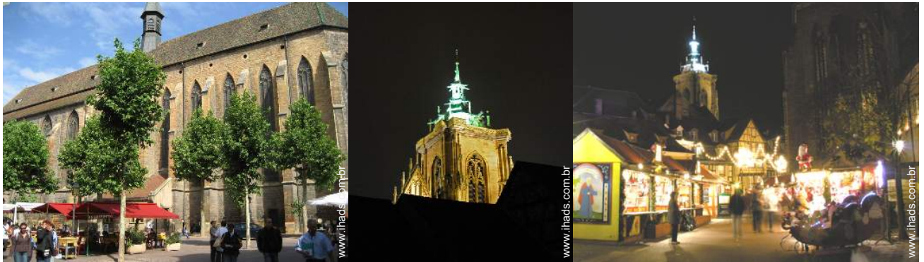
vista a partir da casa