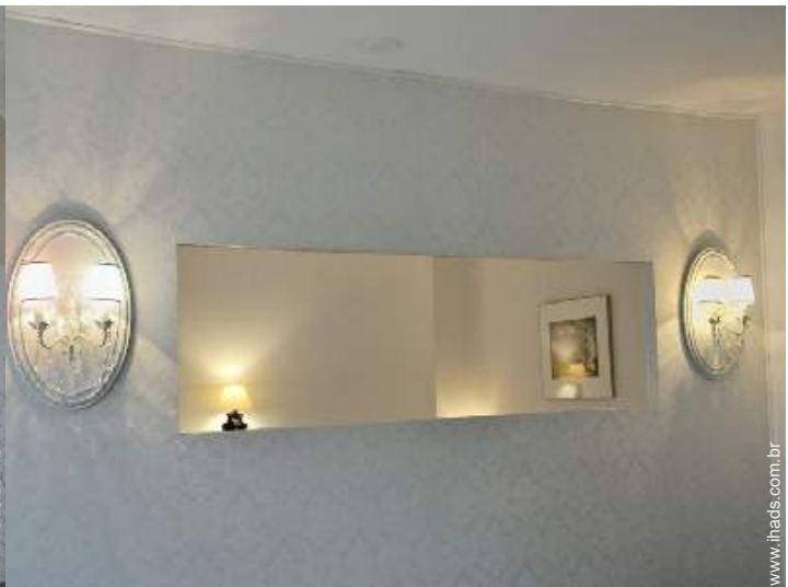
vista a partir do salão