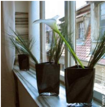
vista a partir da cozinha