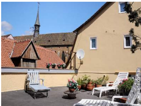
terraço no telhado