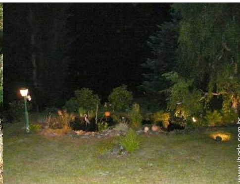
lago de jardim