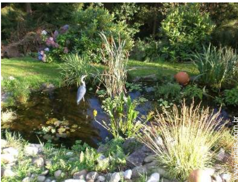
lago de jardim