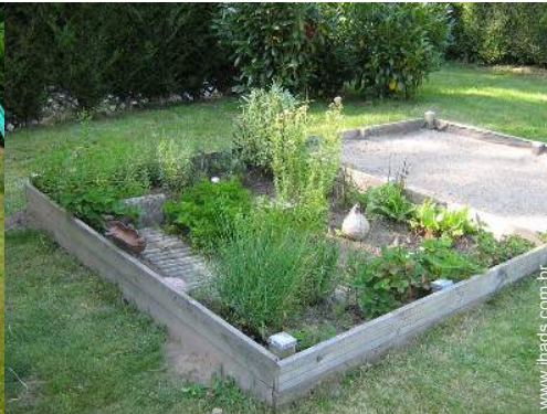
parque infantil com areia