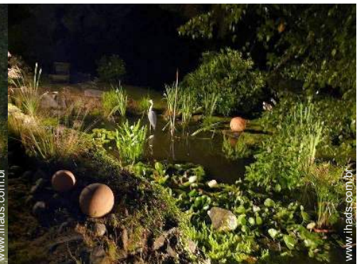
lago de jardim