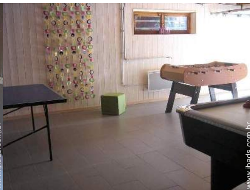
salão de jogos