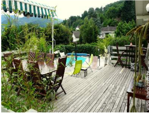
vista a partir da sala de jantar