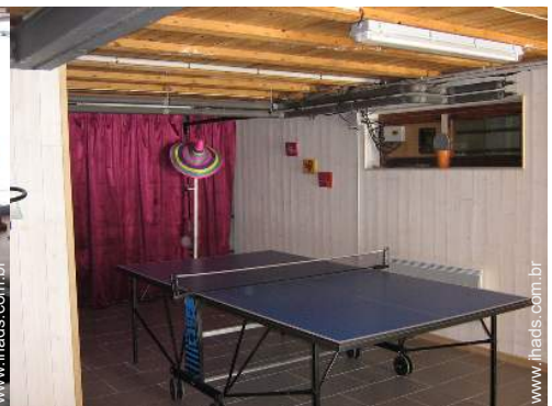
salão de jogos