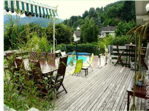
vista a partir da sala de jantar

Barbecue, mesa(s) de jardim, 12 cadeira(s) de jardim, 8 espreguiçadeira(s), baloiço para criança, parque infantil com areia, duche exterior