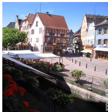
vista rua para peões