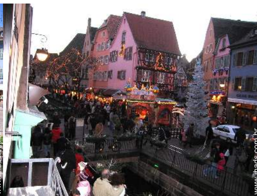
vista para praça