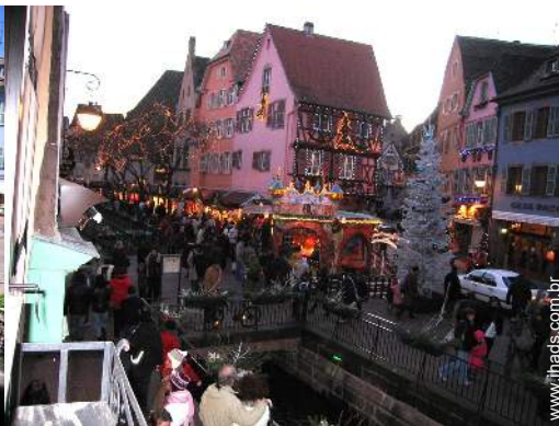
vista para praça