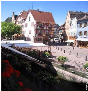
vista rua para peões