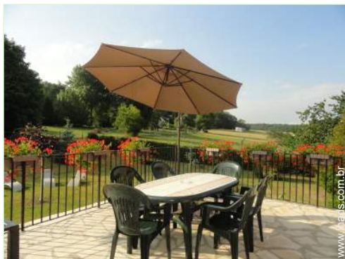
Equipamentos exteriores à disposição dos hóspedes