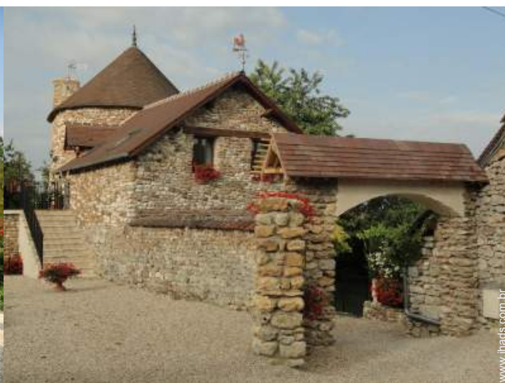
Equipamentos exteriores à disposição dos hóspedes