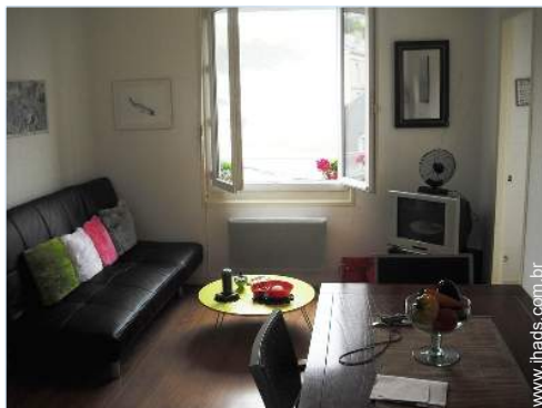
sofá(s) cama 2 pessoas