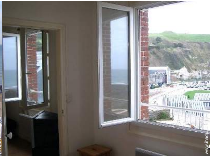
vista a partir do apartamento