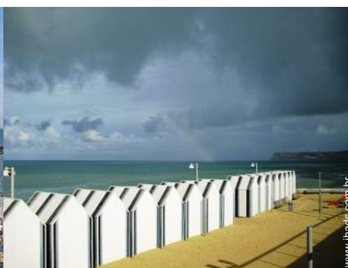
infraestruturas de lazer