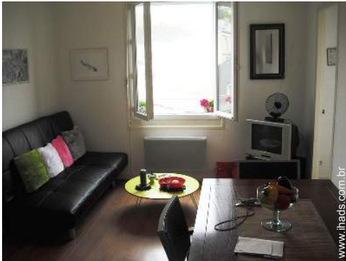
sofá(s) cama 2 pessoas