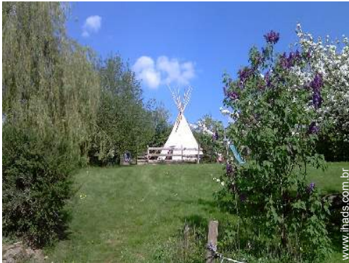
infraestruturas de lazer