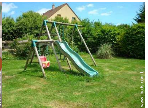
Instalações exteriores à disposição dos hóspedes