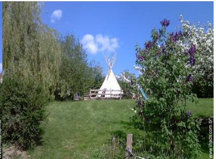
infraestruturas de lazer