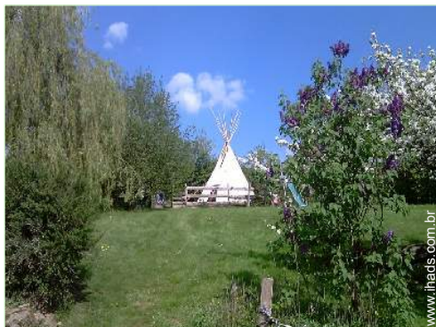
infraestruturas de lazer