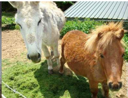
animais da quinta