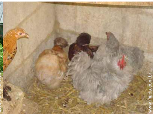
animais da quinta