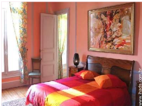
O quarto de hóspede

Cadeira de bebé, fraldário, banheira bebé, bacio bebé