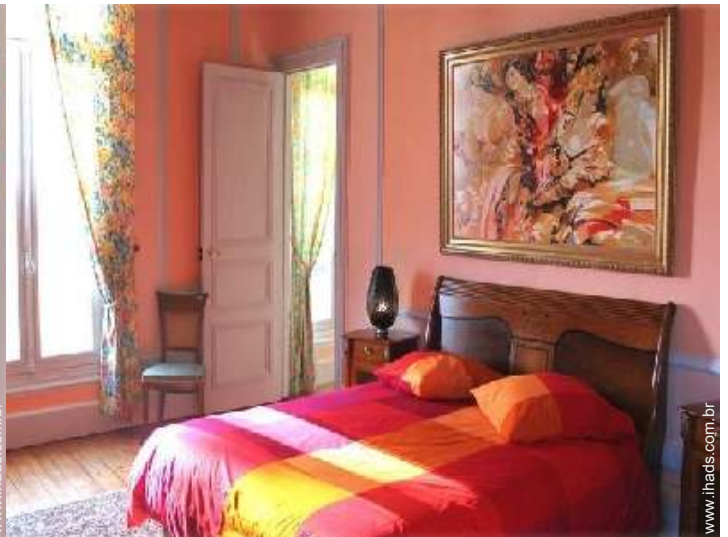
O quarto de hóspede