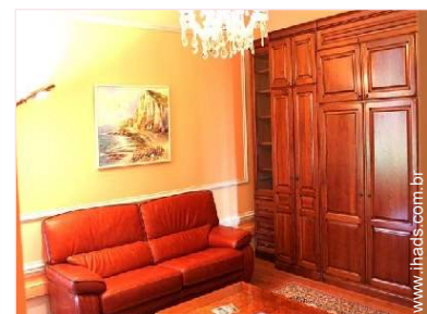
possibilidade de cama(s) extra(s)

TV, leitor de DVD, wi-fi (acesso à Internet sem fios), guarda-fatos, secador de cabelo, seca toalhas, aquecimento central