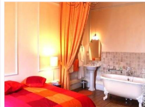
O quarto de hóspede