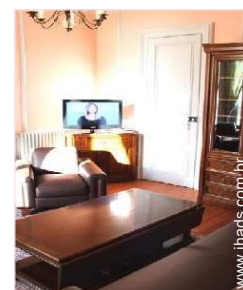
possibilidade de cama(s) extra(s)