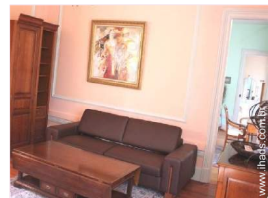
possibilidade de cama(s) extra(s)