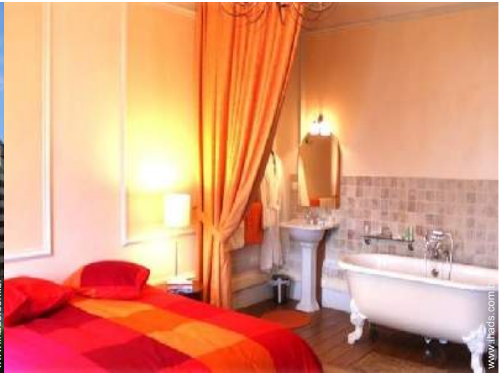
O quarto de hóspede