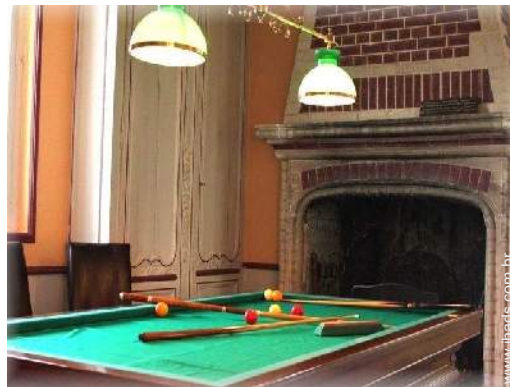
mesa de bilhar