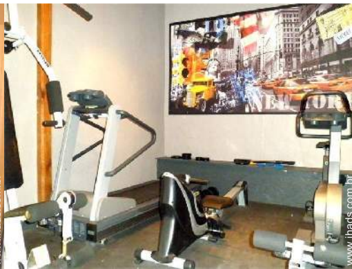
equipamento de musculação