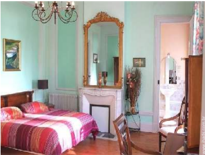
O quarto de hóspede