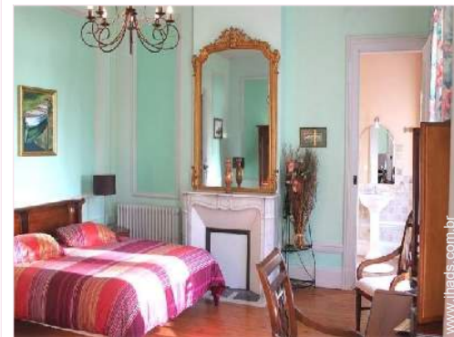
O quarto de hóspede