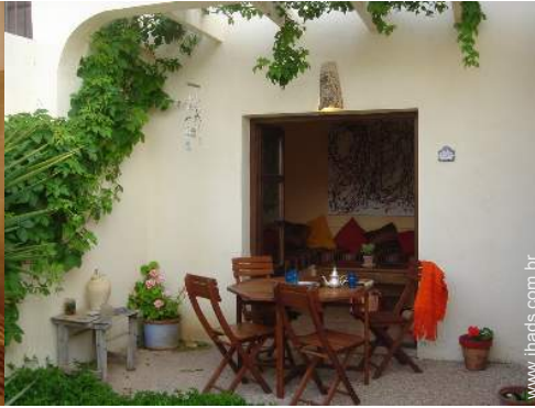
abrigo de jardim