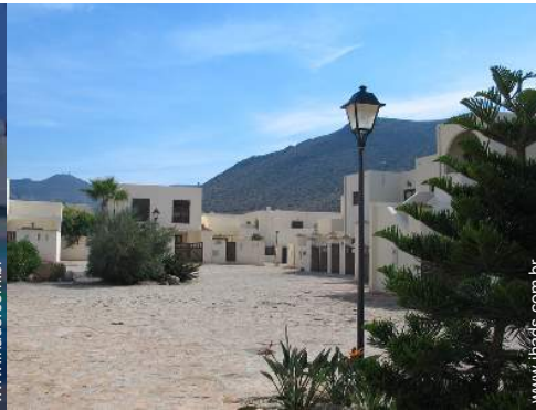
Residência de qualidade