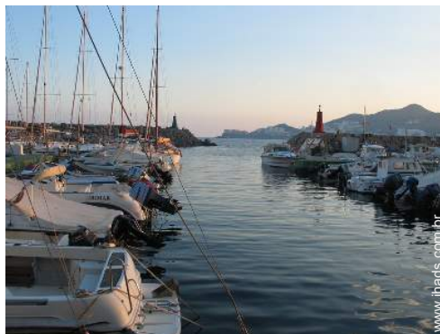
excursão de barco