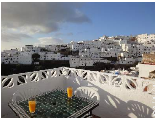
vista a partir do terraço sobre telhado