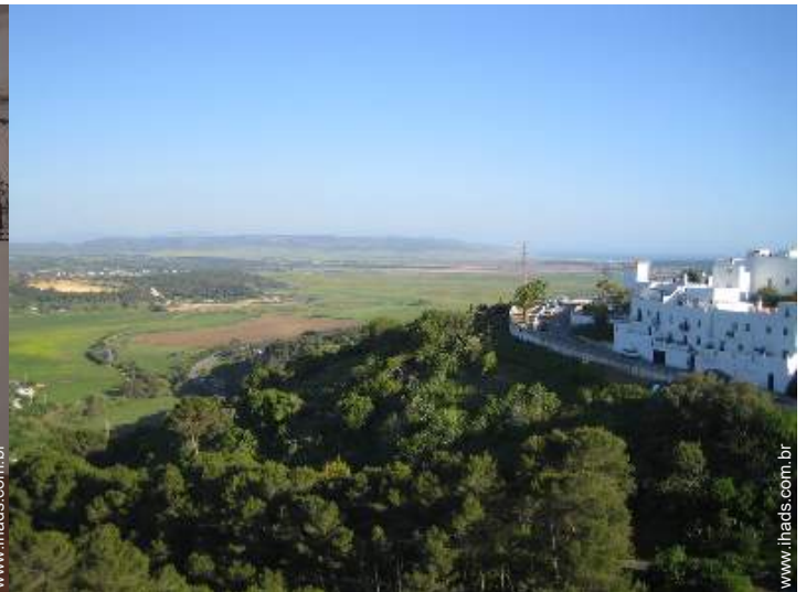
vista a partir do terraço sobre telhado