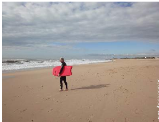
actividades balneares nas proximidades