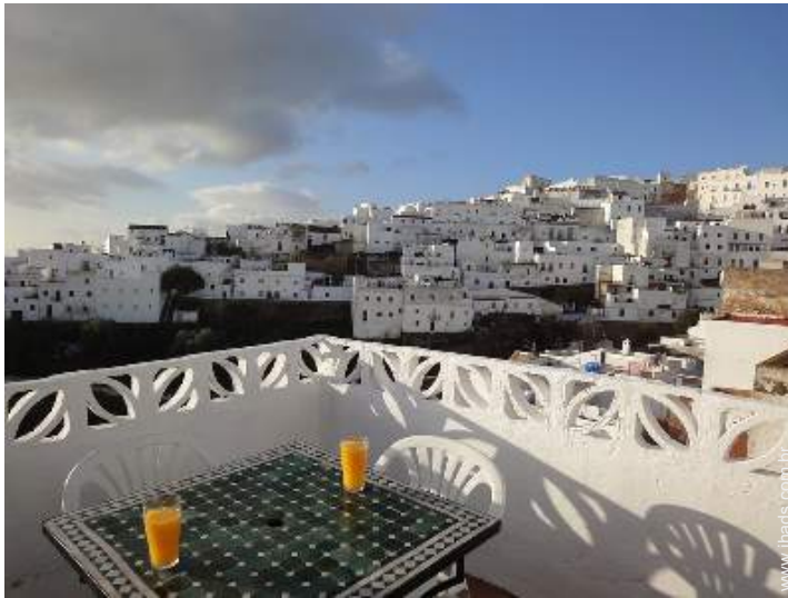
vista a partir do terraço sobre telhado