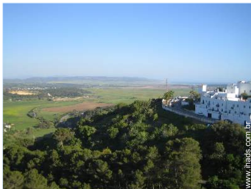
vista a partir do terraço sobre telhado