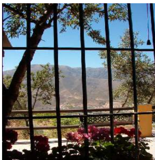
vista a partir do salão