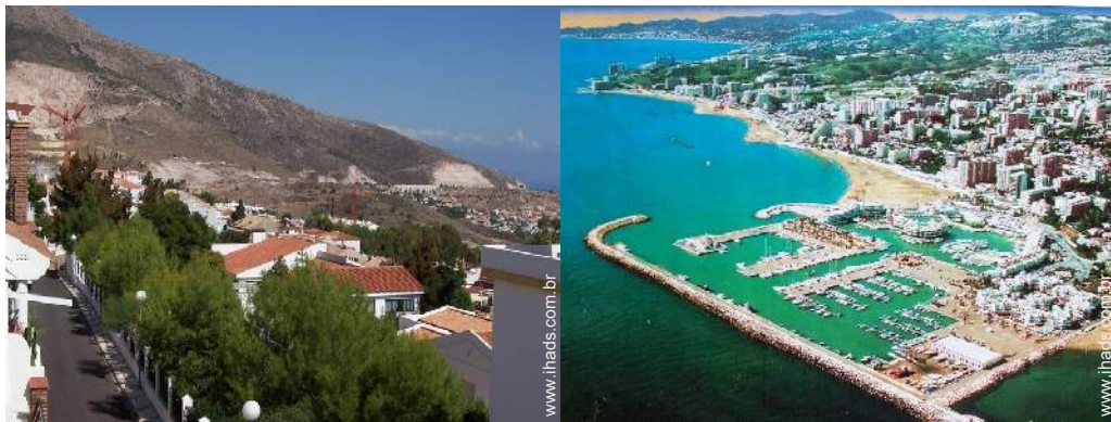
actividades de montanha nas proximidades