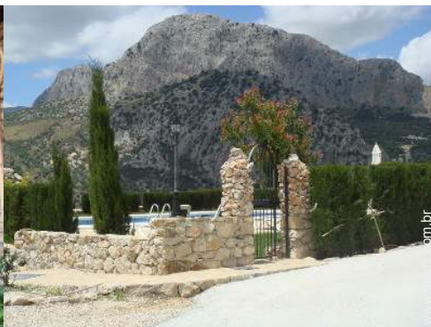
Ambiente exterior à disposição dos hóspedes