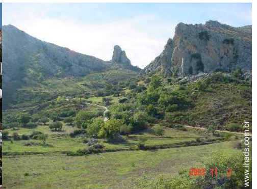
vista de serra