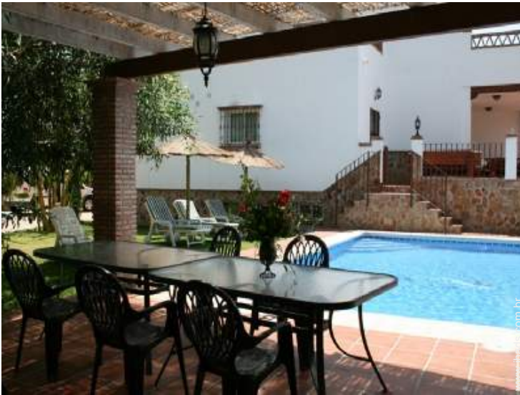
salão de jardim