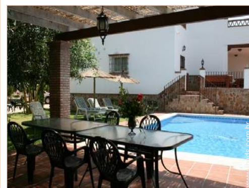
salão de jardim