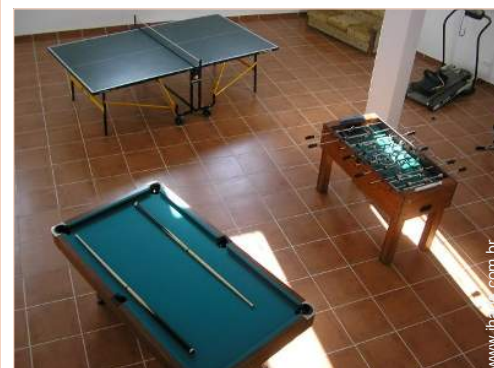
Equipamentos de lazer