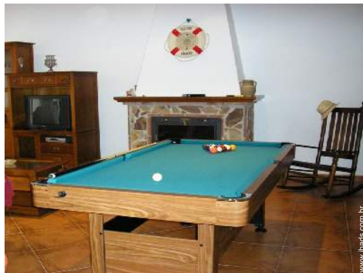
mesa de bilhar