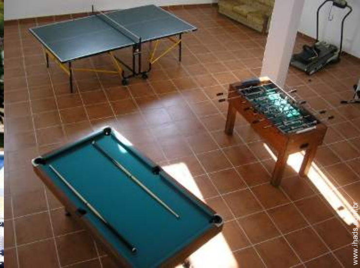
Equipamentos de lazer