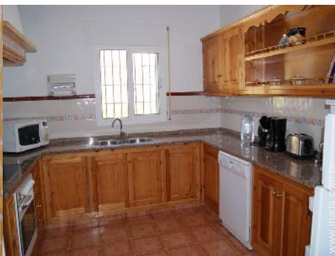
grande cozinha americana