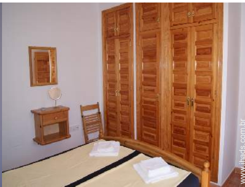
Conforto interior e equipamentos