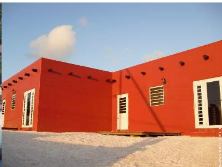
Apartamento de Luxo