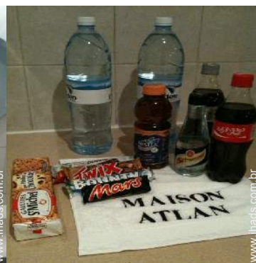
Conforto interior à disposição dos hóspedes