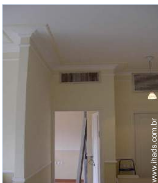
ar condicionado (totalmente)