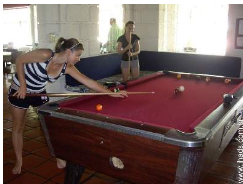
mesa de bilhar