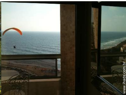
actividades aéreas nas proximidades