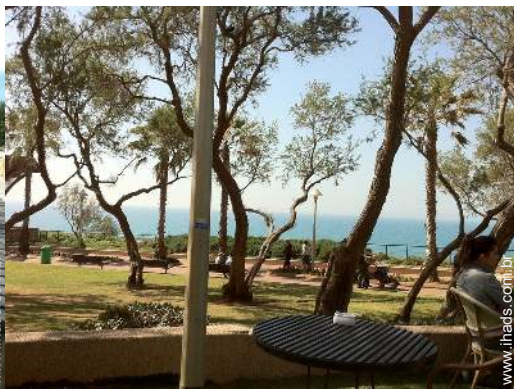
parque e jardim