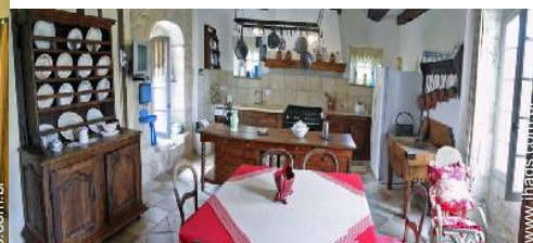
grande cozinha independente