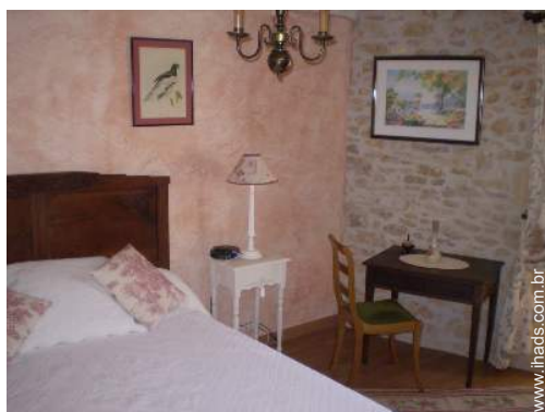
cama(s) de casal