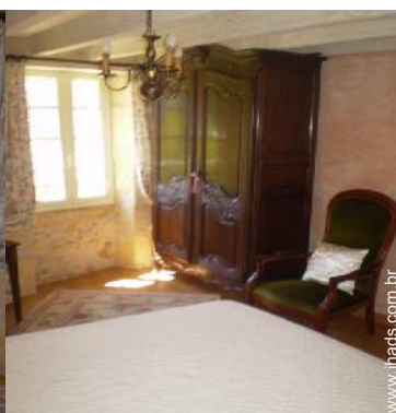
cama(s) de casal