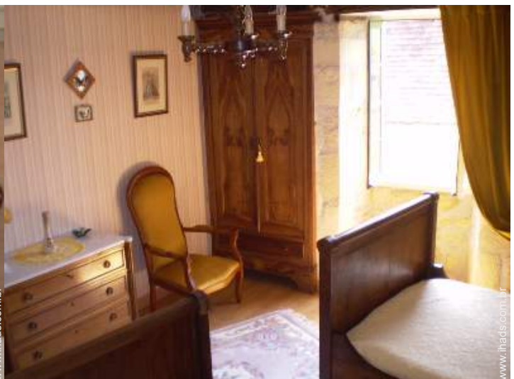
camas separadas simples