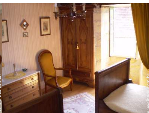
camas separadas simples