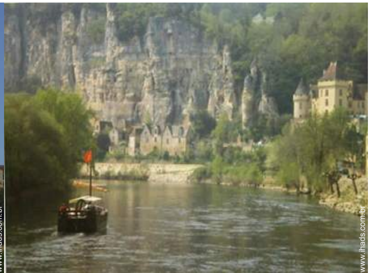
vista para rio