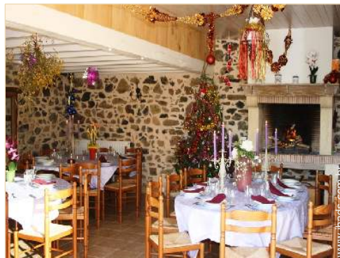
vista a partir da sala de jantar