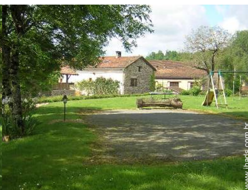
infraestruturas de lazer