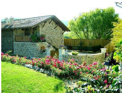
Casa de Encanto