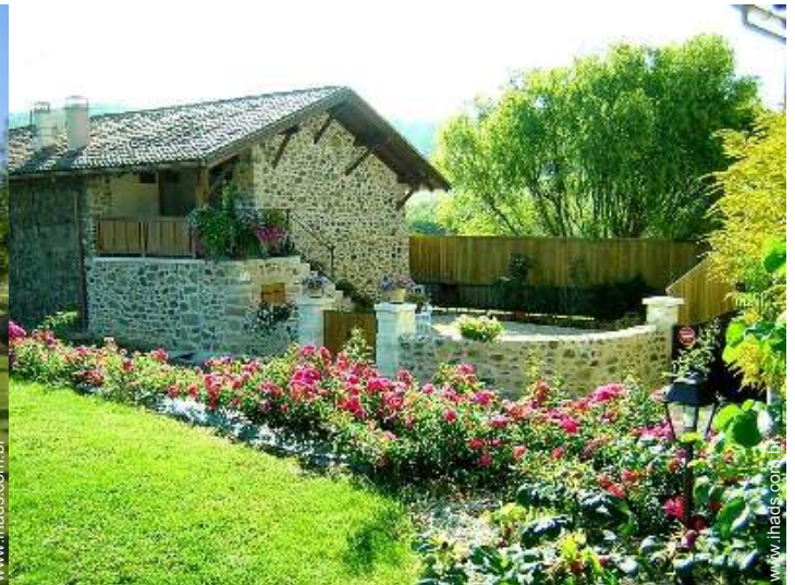
Casa de Encanto