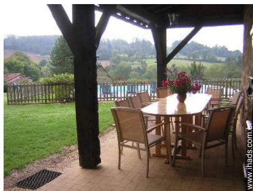
salão de jardim