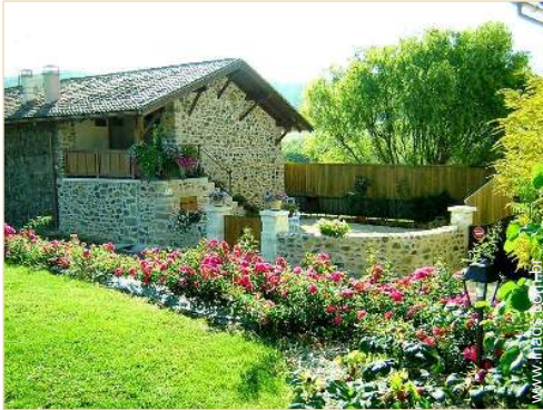
Casa de Encanto