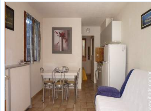
Conforto interior e equipamentos