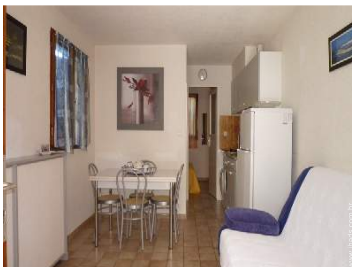
Conforto interior e equipamentos