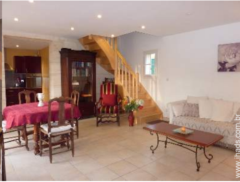
Conforto interior e equipamentos