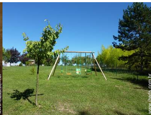
baloço para criança