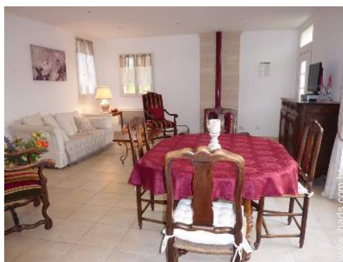
Conforto interior e equipamentos