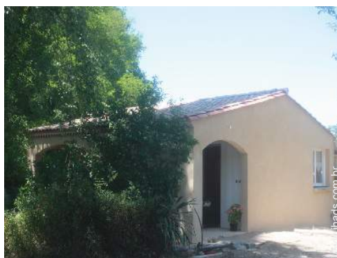
Casa de Encanto