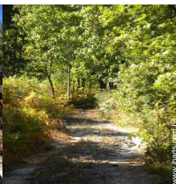
caminho de passeio