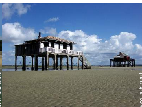
actividades nas proximidades