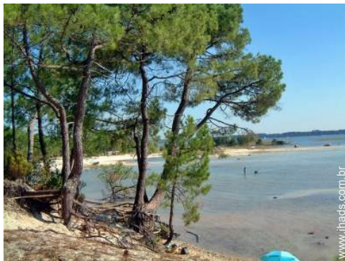
atividades nas proximidades