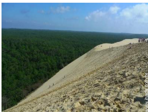
atividades nas proximidades