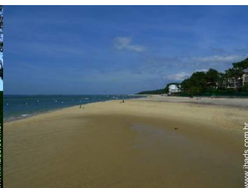
actividades balneares nas proximidades