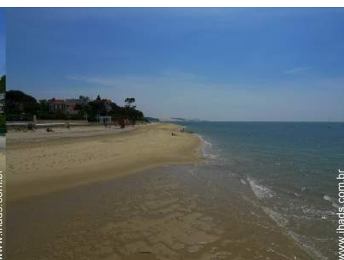
actividades balneares nas proximidades