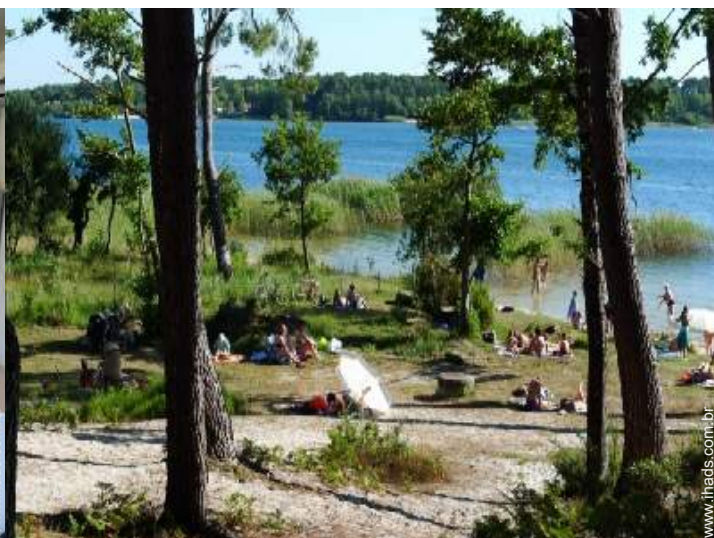
actividades náuticas nas proximidades