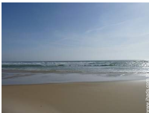
actividades nas proximidades