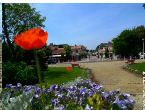
Cidades nas proximidades