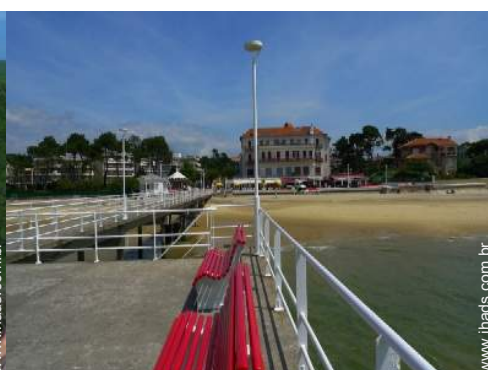
Cidades nas proximidades