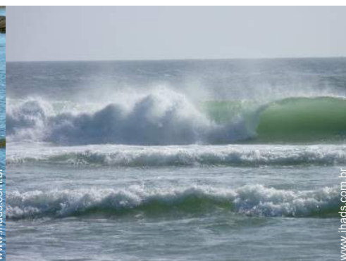
actividades nas proximidades