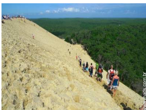
actividades nas proximidades