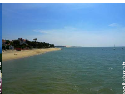
Cidades nas proximidades