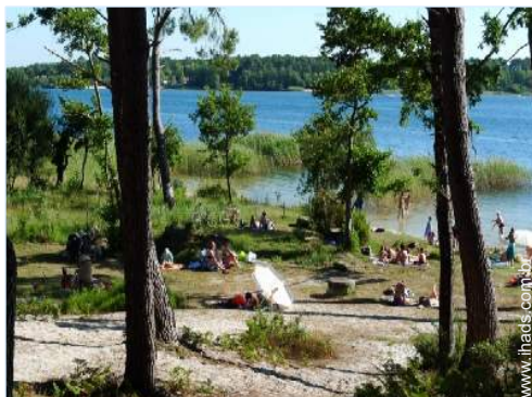
actividades náuticas nas proximidades