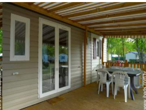
cadeira(s) de jardim