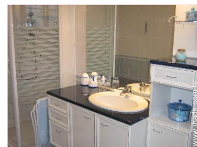
casa de banho comum