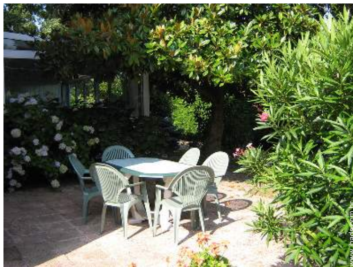
salão de jardim