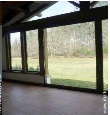
vista a partir da sala de jantar