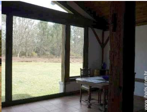
vista a partir da sala de jantar