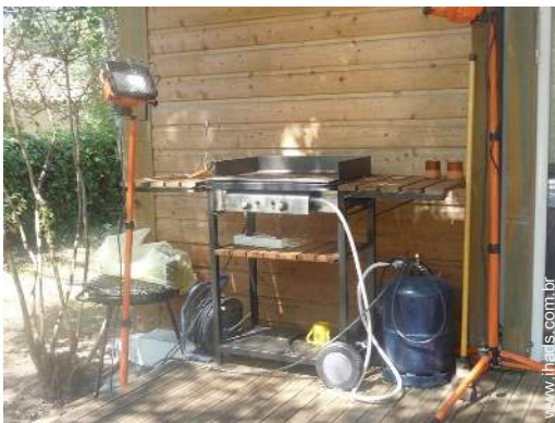
barbecue a gás