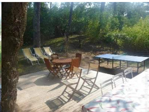
mesa de ping-pong