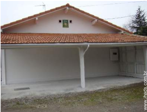
Instalações exteriores à disposição dos hóspedes