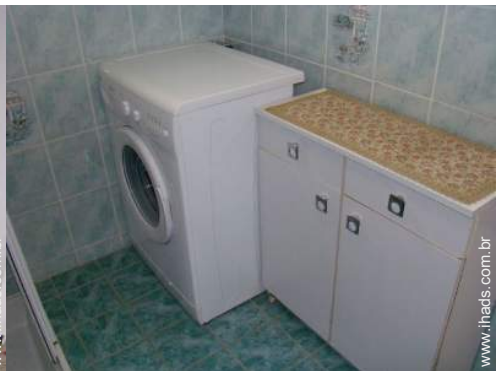
máquina de lavar roupa