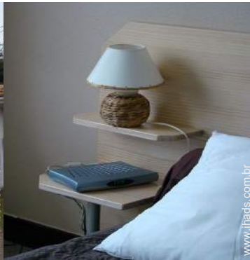
wi-fi (acesso à Internet sem fios)