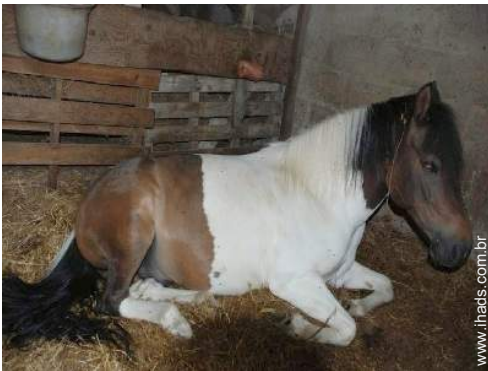
animais da quinta