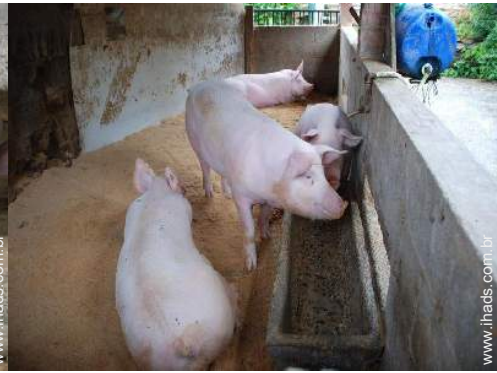
animais da quinta