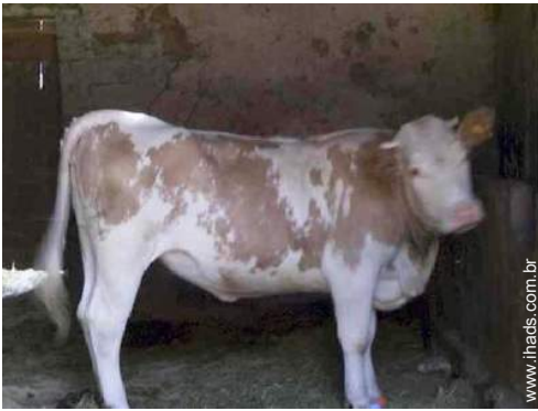
animais da quinta