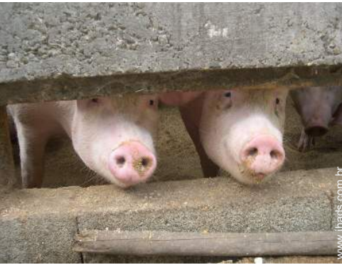
animais da quinta