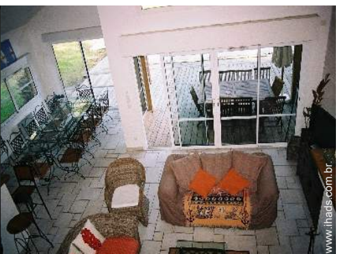
vista a partir da mezzanine