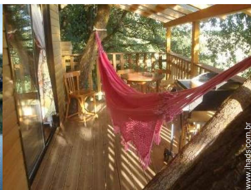
cama de rede