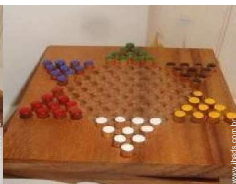
jogos de sociedade