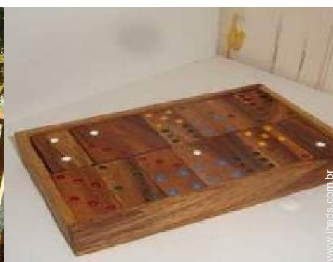
jogos de sociedade